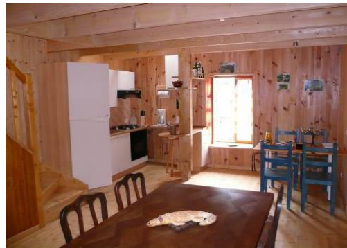
salle à manger- cuisine