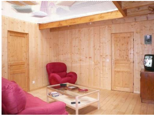
Séjour et deux mezzanines