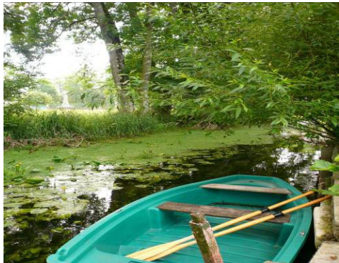
Bief de l'Ormain