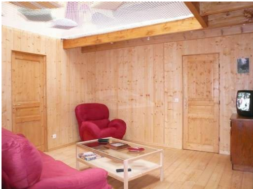
Séjour et deux mezzanines